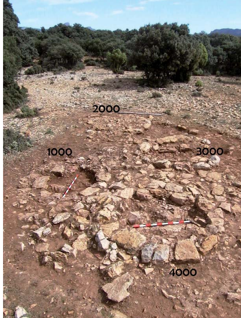
Figura 2. Grup tumulari de la necròpolis del salegar del Mesón del Carro.

Els túmuls amb cambra (2.000 i 3.000) mantenen una orientació semblant, es troben mirant al sud-est. A l'interior de cadascun es va localitzar un conjunt modest d'ossos molt fragmentats i cremats, mesclats amb terra