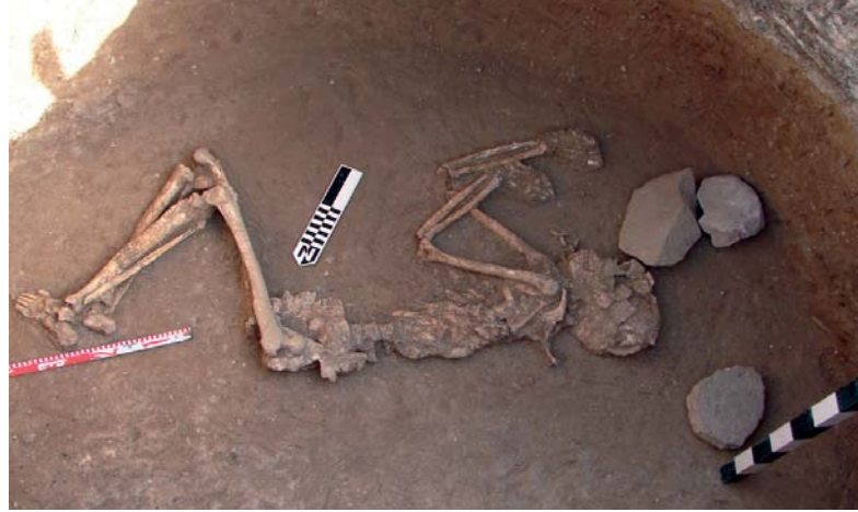
Enterrament de l'estructura 16.

L'estructura 16, sitja de planta circular, base aplanada i forma troncocònica, amb 1,31 m de diàmetre superior, 2,09 m de diàmetre inferior i 1,35 m de profunditat. De farciment complex, s'hi van distingir diverses unitats estratigràfiques. Els materials són variats, i hi destaquen les restes ceràmiques; entre elles, abundants elements de pressió: mamellons i llengüetes, tipològicament hi destaquen els vasos de classe A, és a dir, plats, plàteres i escudelles, entre aquestes un plat d'ala plana, també els vasos de classe B, bols hemisfèrics i globulars i olles de la classe C. Dins del farciment abunden les restes de talla, la fauna i la malacofauna. Les restes humanes descansen sobre la base de l'estructura. La seua posició és decúbit