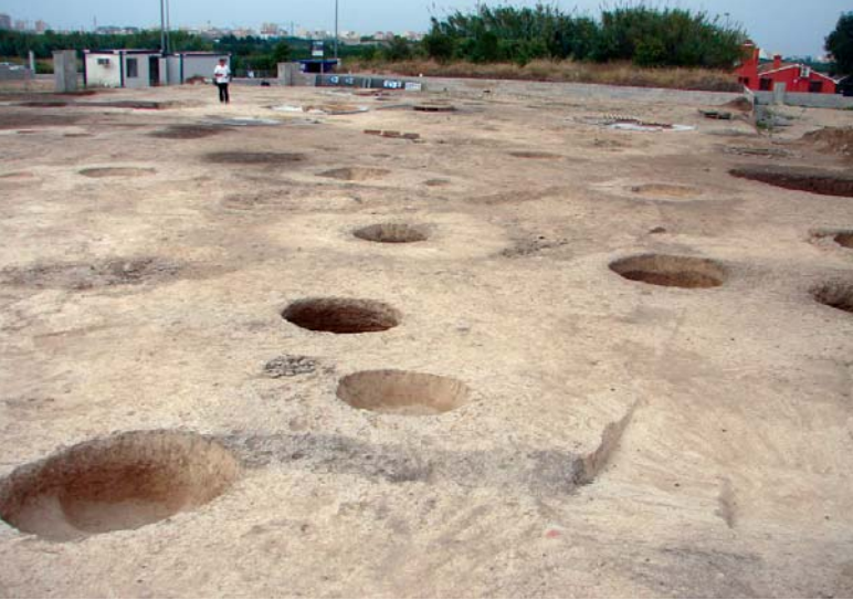
Vista parcial del jaciment.

Aquest tipus d'estructures, segons allò que sabem en l'actualitat, posseeixen una o diverses funcions primàries i altres de secundàries. En un primer moment, la funció que s'atribueix a la majoria d'estructures, sitges i fosses (es tracta en la majoria dels casos de sitges, tallades), és a dir, de recipients d'emmagatzematge, és la de graners per a cereals principalment. Les estructures, una vegada s'erosionen, s'utilitzen majoritàriament com a abocadors (per aquesta raó el farciment és tan desigual), i vam pensar que s'amortitzen de manera ràpida, amb les deixalles antròpiques, tal com ens mostra la sedimentació en aquestes estructures. Unes altres, les menys, tal com veiem no sols a Beniteixir, sinó també a l'Arenal de la Costa i possiblement a l'Atarcó, Missena i l'Alqueria de Sant Andreu, són