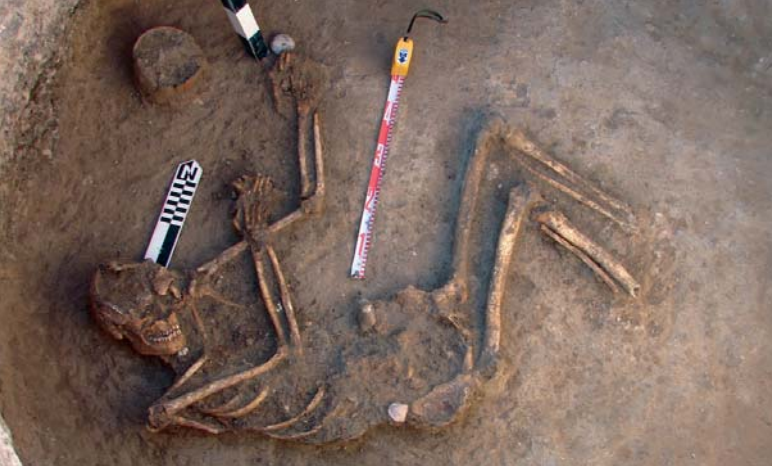
Enterrament de l'estructura 13.

tius i amb les autoritats locals, van permetre delimitar l'«àrea de protecció arqueològica» convenient per a aquesta zona d'expansió urbanística del municipi de Piles.