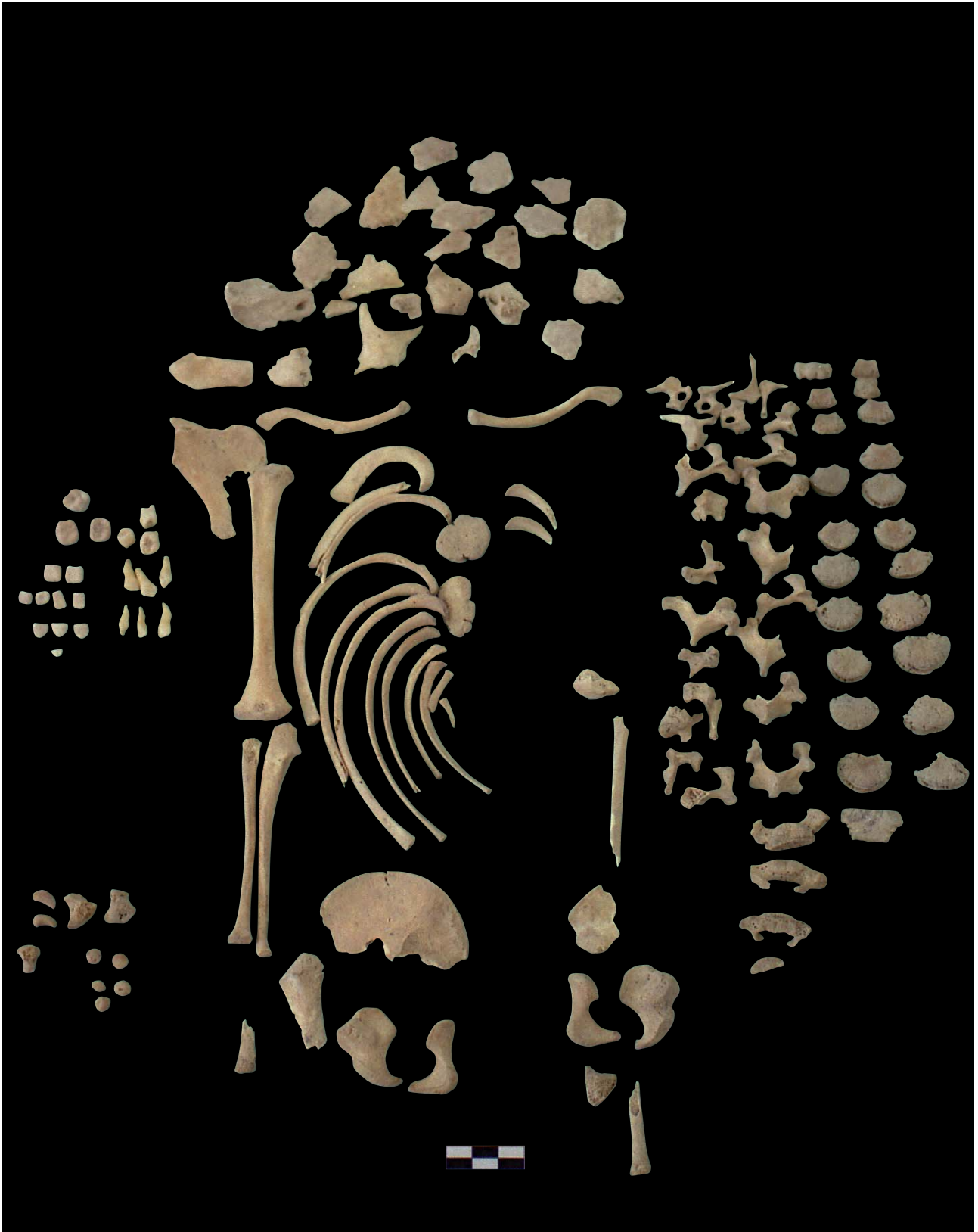
Figura 3. Restes infantils de la Illeta dels Banyets (El Campello, Alacant).