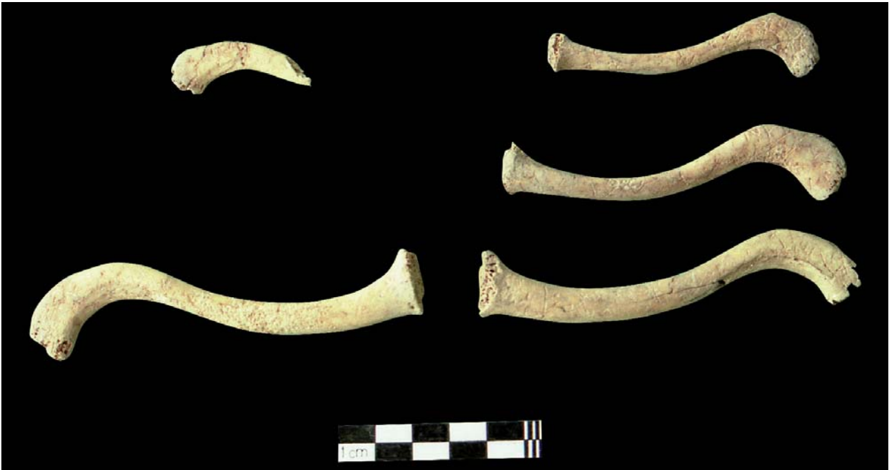
Figura 1. Restes claviculars de tres infants trobats al mateix espai sepulcral. Cabezo Redondo (Villena).

d'individus infantils des del neolític fins a l'edat del bronze. En alguns casos les dades procedeixen de treballs propis, alguns d'ells inèdits, i en altres ens assortirem dels realitzats per diferents equips d'investigació en terres valencianes. En realitat són pocs en termes absoluts però, de gran rellevància a l'hora de recuperar un protagonisme del qual durant molt de temps se'ls ha privat.