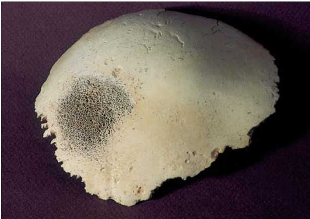
Figura 2. Hiperostosi parietal (Coveta Emparetà, Bocairent, València).

La identificació del sexe en la població infantil és molt més complexa que en l'adult, ja que les característiques sexuals es defineixen a partir de la pubertat, per la qual cosa tan sols les determinacions d'ADN podrien oferir-nos aquesta informació de manera fiable, si bé la seua complexitat fa que no siga un mètode accessible en l'actualitat. La seua rellevància no és poca ja que permetria reconèixer si hi ha una diferenciació per sexes entre els infants conservats, cosa que ens portaria a obtenir una informació sociocultural molt rellevant a l'hora d'interpretar la seua presència en els diferents jaciments.