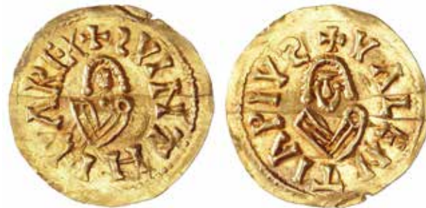
Trient de Suinthila encunyat a Valentia .

es coneix un exemplar, la troballa del qual, en l'edifici de la Universitat, el 1844 —en contra del que sol ser habitual en aquests casos—, va ser ben documentat, a pesar del seu caràcter fortuït. Presenta el bust del rei de front, en les dues cares, amb la llegenda que el rodeja. El disseny es correspon amb els tipus propis de la Tarraconensis .