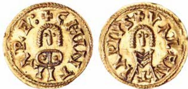
Trient de Khintila encunyat a Valentia . Col·lecció Vidal Valle. numisdata.org