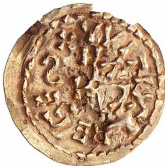
Trient d'Ègica-Vítiza encunyat a Saguntum . Col·lecció Vidal Valle. numisdata.org

és exclusiva de València, ni d'Hispania, però tampoc no és quelcom que es donara en molts casos.