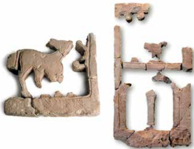
Plaques decorades procedents de la basílica d'Ilici (segles VI-VII).

litzat que afecta l'arquitectura urbana i rural, tant pública com privada, entre els segles v i vi.