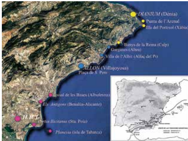
Principals ciutats amb enclavaments costaners i portuaris que jalonen els respectius territoris. Plànol de la província Spaniae bizantina, segons Vizcaino (2009, fig. 2, 48).

províncies noves, diòcesis, vicaris, canvis de rang dels governadors i prefectures.