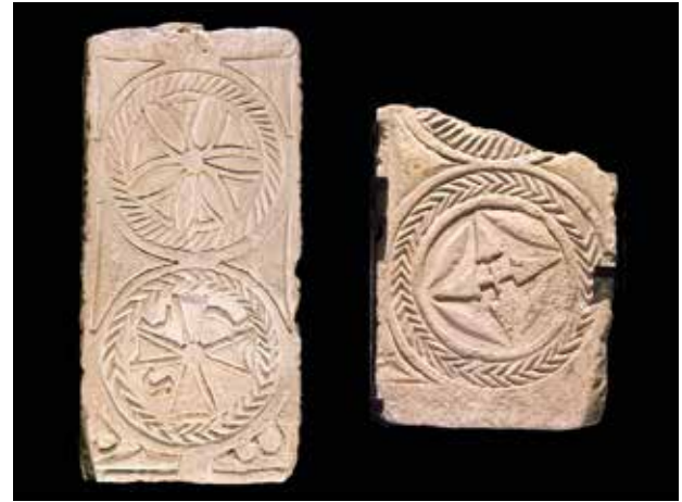
Lloses sepulcral amb simbologia cristiana de l'Albufera (arxiu fotogràfic).

Amb la definició de la nova província, la meitat meridional de l'antiga costa de la Citerior va adquirir personalitat pròpia i va articular les rutes de navegació del quadrant sud-est de la Mediterrània occidental, com també les comunicacions a l'Atlàntic, Àfrica i, pel canal d'Eivissa i les Balears, cap al quadrant nord-est de la Mediterrània occidental i central. La franja marítima de la nova província es vertebrava principalment entorn de tres antigues colònies, travessades també per la via Augusta, que llavors mostraven distints polsos: Valentia , Ilici i Carthago Nova . Enfront de les altres dos, la revisió de les estratigrafies d' Ilici apunta un panorama general de prosperitat. La colònia conservava un urbanisme compacte que ocupa totes les àrees sondejades, amb el manteniment dels