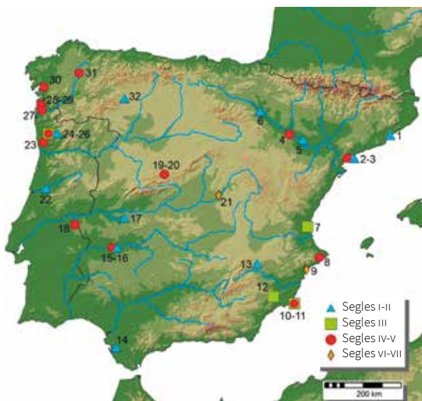
Mapa dels tallers de vidre i la seua documentació arqueològica a la península Ibèrica.

seguir les mateixes pautes constructives i manufactureres que en segles anteriors. Fet d'altra banda constatable en il·lustracions altmedievales, on apareixen aquests xicotets forns en funcionament.