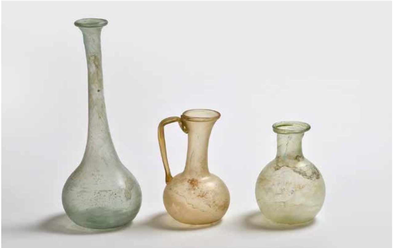
Conjunt d'ampolles de vidre procedents de la necròpoli de València.

i gots, encara que també hi han aparegut en contextos funeraris. El tret més característic d'aquests perfils és la vora engrossida i polida al foc, generalment exvasada i sinuosa amb engrossiment en la cara interna de la paret, en alguns casos apareixen línies de polit paral·leles a la vora, les bases són àpodes amb engrossiment de vidre en el centre i restes de marca de puntill. El grup que estudiem està constituït per peces llises sense decoració, els plats i bols són