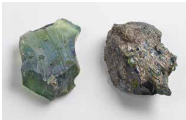
Lingots de vidre en brut d'importació per al seu processat local.

Finalment cal assenyalar un fragment d'ansa nervada de secció en cinta. És una de les formes més corrents