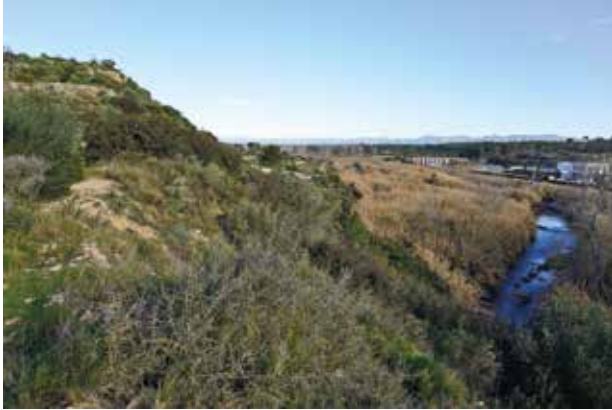
Vista del riu Túria al seu pas per València la Vella. S'aprecien els murs de l'acròpolis a la zona alta.

restes arquitectòniques i establiren una cronologia del segle IV dC en avant. Amb això desaparegué el mite arcaïtzant de València la Vella i s'obriren noves incògnites històriques. No obstant això, la nova cronologia va comportar un desinterés per part de la recerca arqueològica valenciana, orientada cap a altres períodes històrics en aquell moment.