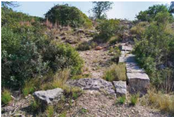
Vista actual de la zona monumental envaïda per la vegetació.

recuperades, procedeixen de seques de nombrosos indrets d'Hispania i de la Mediterrània que ens assenyalen la vitalitat econòmica i comercial del lloc.