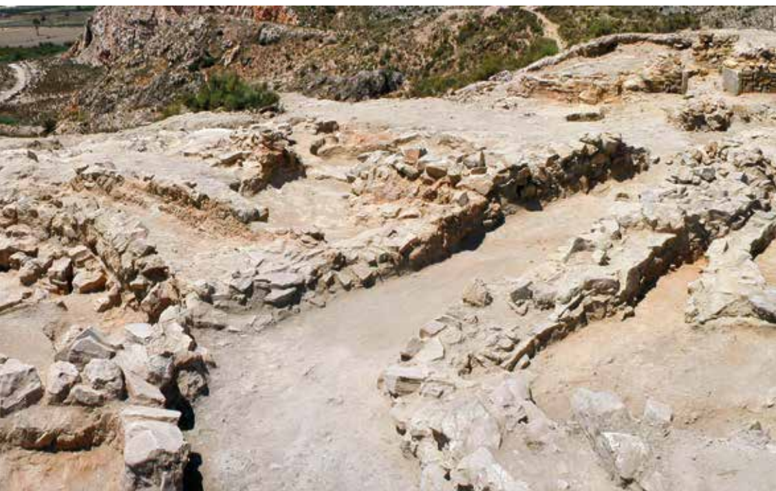
Fig. 4A. Cabezo Pardo (Sant Isidre / la Granja de Rocamora). Restes de l'edifici central (a la dreta), del carrer i dels departaments situats al sud (fons i esquerra).