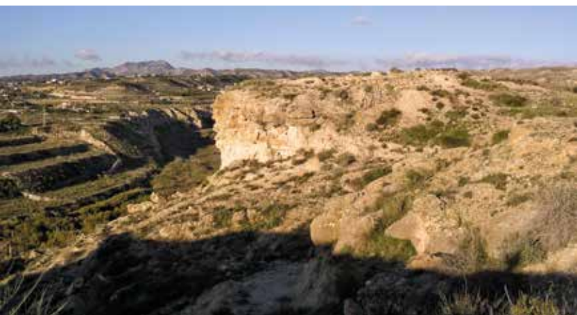
Fig. 2A. Vista de Caramoro I, ubicat en un talús sobre el llit del Vinalopó.