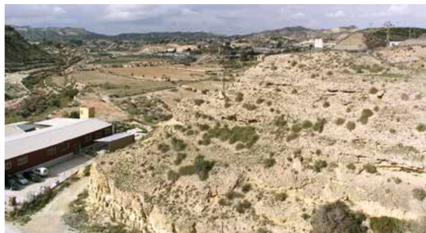
Fig. 2B. Barranc dels Arcs, emplaçat en una posició similar, sobre el barranc del mateix nom.

treballs pioners de Julio Furgús (1937) i Josep Colominas (1936) a San Antón i Laderas del Castillo.