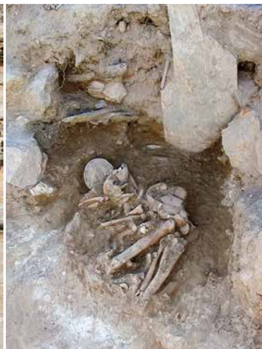
Fig. 4B. Detall de l'enterrament femení de la tomba 1. L'esquelet jau recolzat sobre el seu costat esquerre, amb els braços i les cames fortament flexionats. A l'esquena, un bol de ceràmica.

parets, aquestes, a més, revocades amb una capa de calç de color blanc. És l'única construcció d'aquestes característiques localitzada al jaciment. Quasi tots els edificis van ser destruïts sense que es trobaren en el seu interior evidències d'incendis, i sobre les seues ruïnes es va alçar un altre conjunt d'estructures que repetien el mateix esquema urbanístic precedent, i que va perdurar almenys fins a l'abandó definitiu de l'enclavament, entorn de 1550/1500 cal BC. Resulten molt notables les semblances que en aquest aspecte guarda Cabezo Pardo amb l'orga-