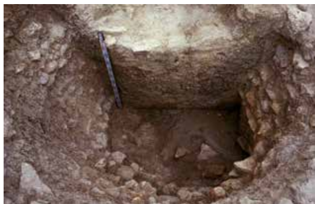
Cisterna localitzada al vessant meridional, al costat de l'Habitació I. Cisterna localitzada entre les habitacions II i III, al costat del vessant oriental.

empedrat amb còdols que ascendeix des de la part mitjana del vessant oriental. Al costat de la porta de la casa, les plataformes o terrasses estan assenyalades per murs de pedra de disposició atalussada no molt acurada, deixant la cara externa visible i omplint amb terra l'interior fins a anivellar i crear espais plans. La zona pareix correspondre a un femer on s'han recuperat nombroses restes de fauna i ceràmica molt fragmentada, grans de collar abundants, bellotes carbonitzades i restes d'estructures de terra en-