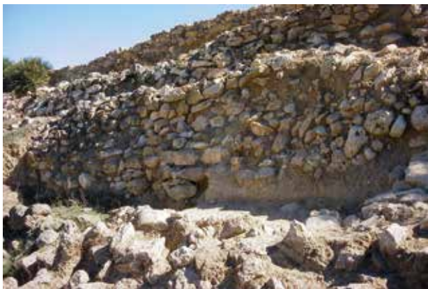
Sector oest: mur en talús i mur del Corredor.