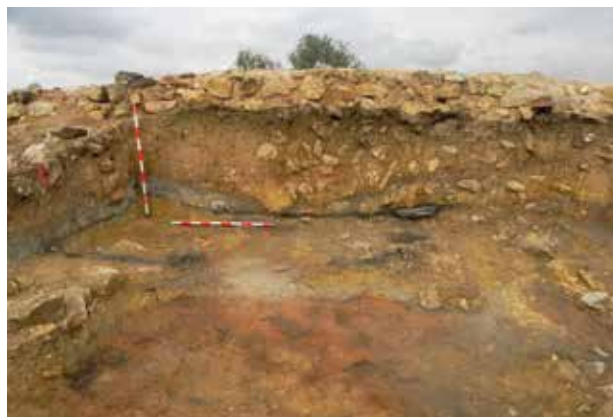
Departament adossat a l'Habitació I, al vessant oriental.

Les mostres de fusta carbonitzada procedents de la coberta de l'edifici i de carbó dispers totes elles de pi, permeten datar la construcció al principi del II mil·lenni aC. I la seua destrucció al voltant del 1600-1500 aC, d'acord amb dues mostres de cereal carbonitzat trobat sobre el terra de les habitacions I i II. De l'Habitació III una data prèvia a la construcció, al voltant de 1900 aC, procedeix de la neteja de sòls existents amb anterioritat, de les habitacions pròximes, i una datació de la fusta utilitzada