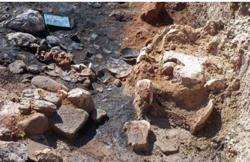
Sòl d'ocupació de l'Habitació II, ceràmica cremada i fragmentada i molí adossat al mur occidental.

irregularitats tant del mur com del sòl rocós i està revestida per una capa grossa d'argila grisa que va servir com a capa d'aïllament contra la humitat o com a revestiment impermeable. La seua funció com a cisterna o aljub està confirmada per les anàlisis sedimentològiques fetes i la seua datació és contemporània a la de l'habitatge contigu. La seua capacitat, atenent al seu perímetre i a la seua profunditat, era de 5,25 m 3 , per la qual cosa es tracta d'un aprovisionament d'aigua modest destinat a cobrir les necessitats mínimes del grup, que arreplega l'aigua de la coberta en terrassa de l'Habitació I. Segons pareix, la cisterna estava situada en una espècie de porxo o terrassa delimitada per un mur de pedra, al costat del camí que puja des del sud, i a la qual s'accedeix des del Corredor oest.