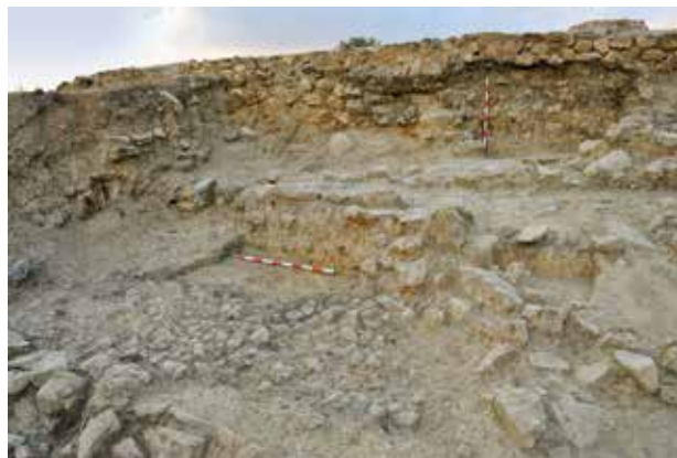
Sector est: mur oriental de les habitacions I i II, empedrat de còdols al vessant i murs en talús de les terrasses.

lluïdes. En el mateix sector s'ha localitzat una fossa circular d'1 m de diàmetre, excavada en el conglomerat de base de la muntanya, que es trobava pràcticament buida. Altres instal·lacions en l'extrem sud-est corresponen, almenys, a dos departaments xicotets de planta quadrangular, adossats a l'Habitació I; i a una cubeta o bassa de planta aproximadament rectangular, feta amb murets de terra enlluïts.