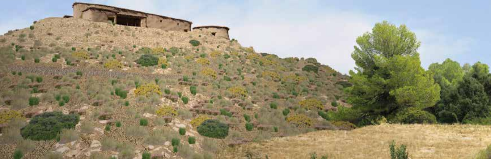
Reconstrucció virtual del poblat i de l'entorn.

Els materials de construcció utilitzats es troben, generalment, en les proximitats dels assentaments: la pedra per a alçar murs, enllosats o empedrats; la terra per a la travada de murs, sòls, arrebossats i enlluïts; i la fusta i altres elements d'origen vegetal per a les bigues i pals, i també per a la carcassa de la sostrada.