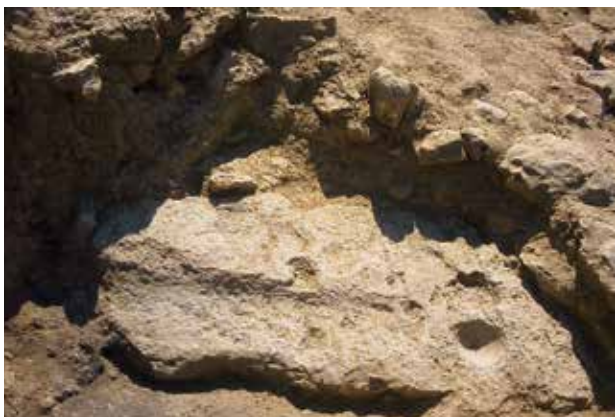
El Corredor oest, una vegada finalitzada la seua excavació. Accés al Corredor oest des del sud. Detall de la pedra de la polleguera.

costat d'una paret, i un conjunt de dents de falç al costat del mur del corredor lateral. Destaca l'absència de restes de fauna i de foguers, per la qual cosa cal suposar que les habitacions es netejaven amb regularitat.