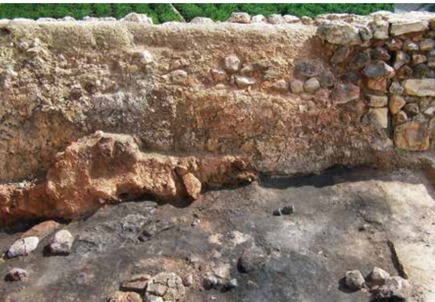
Murs enlluïts de les habitacions I i II i sòl d'ocupació cremat.

Els pins són l'espècie més abundant i la seua distribució sobre el sòl és heterogènia i desordenada, i estan mesclats amb les restes de morter de terra o tàpia procedents de la sostrada de la qual formaven part, mentre que les carrasques s'associen a les dues sèries longitudinals de pedres planes. Les empremtes que canyes i brancatge han deixat en els fragments de tàpia, junt amb les restes de pins, indiquen que aquesta constava d'una carcassa de bigues i travesseres de troncs de pi sense escairar, entrecreuats i units per mitjà de cordes d'espart, recoberta per una altra més lleugera de canyes i brancatge (lenticle, ullastre, espart, argilagues, etc.) sobre la qual s'estendria un llit de terra argilosa que impermeabilitzaria la