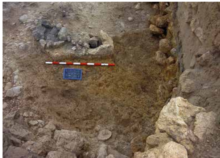
Forats de pal sobre el sòl de l'Habitació III.

irregularitats tant del mur com del sòl rocós i està revestida per una capa grossa d'argila grisa que va servir com a capa d'aïllament contra la humitat o com a revestiment impermeable. La seua funció com a cisterna o aljub està confirmada per les anàlisis sedimentològiques fetes i la seua datació és contemporània a la de l'habitatge contigu. La seua capacitat, atenent al seu perímetre i a la seua profunditat, era de 5,25 m 3 , per la qual cosa es tracta d'un aprovisionament d'aigua modest destinat a cobrir les necessitats mínimes del grup, que arreplega l'aigua de la coberta en terrassa de l'Habitació I. Segons pareix, la cisterna estava situada en una espècie de porxo o terrassa delimitada per un mur de pedra, al costat del camí que puja des del sud, i a la qual s'accedeix des del Corredor oest.